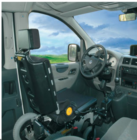
SALI E GUIDA. Questa trasformazione permette di guidare seduto sulla carrozzina di